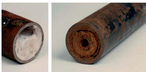
Boiler scale on water side